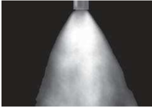
cône creux 70°